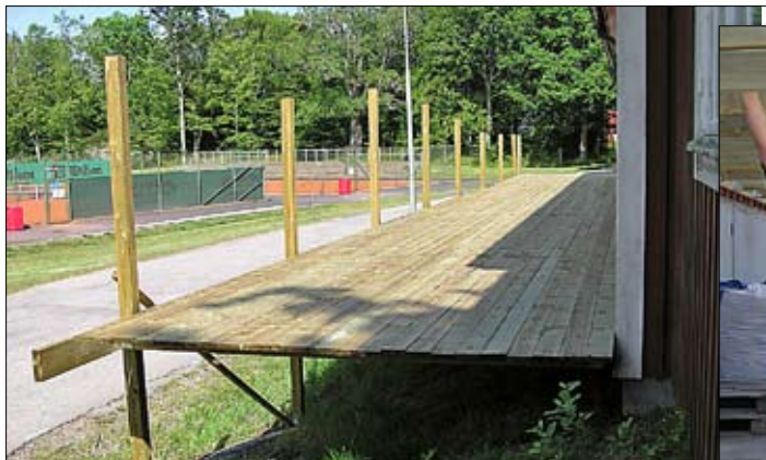
Altandücket monterat. Räckat återstår.

Nu har arbetet med att modernisera och delvis bygga om klubbhuset pågått i drygt 1½ år. Arbetet startade med att invändigt riva ett antal väggar i syfte att åstadkomma en öppen planlösning. Sedan har arbetet övergått till att måla, tapetsera, lägga golv, göra i ordning handikaptoalett, koppla in vatten och installera ett nytt kök. Klubbhuset har också försetts med ett inbrottslarm kopplat till Securitas larmtjänst.