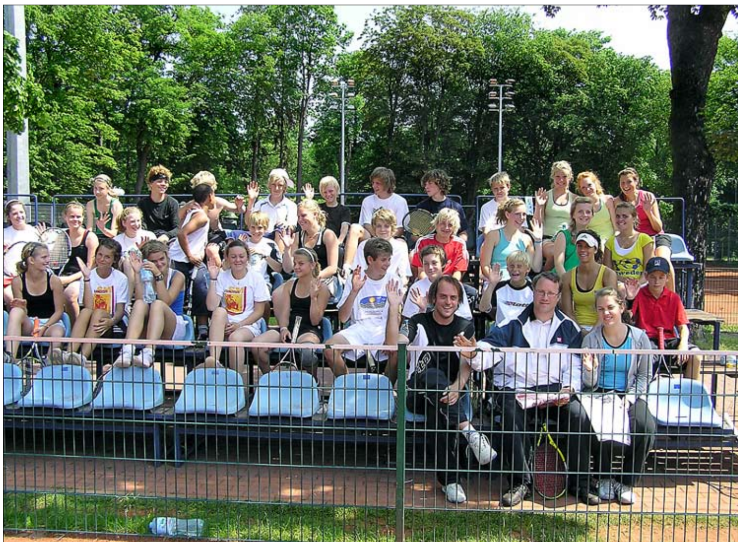
Samtliga tränare och juniorer samlade för ytterligare ett pass.

Tack vare en av klubbens största sponsorer: Stena Line, kunde KTK's tävlingjuniorer än en gång åka till Polen för att slipa grusformen. Årets läger blev det hittills mest lyckade.