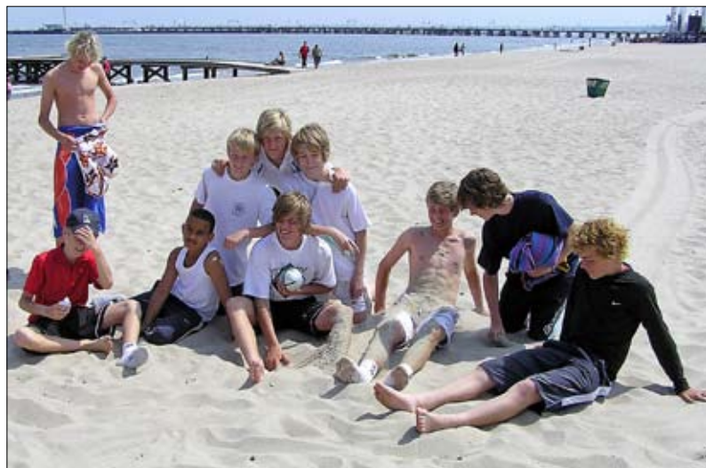
Skön avkoppling på beachen.