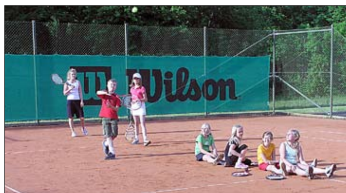
Träning på att sitta still och röra på sig.