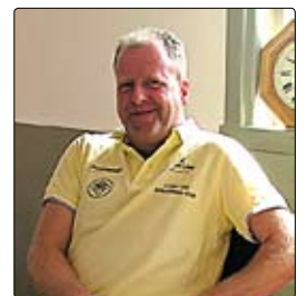
Hasse - alltiallo i klubbhuset.

bord till altanen, dvs. möbler som inte omedelbart får fötter och hamnar på annan plats. Detta för att slippa kedja fast möblerna på kvällarna.