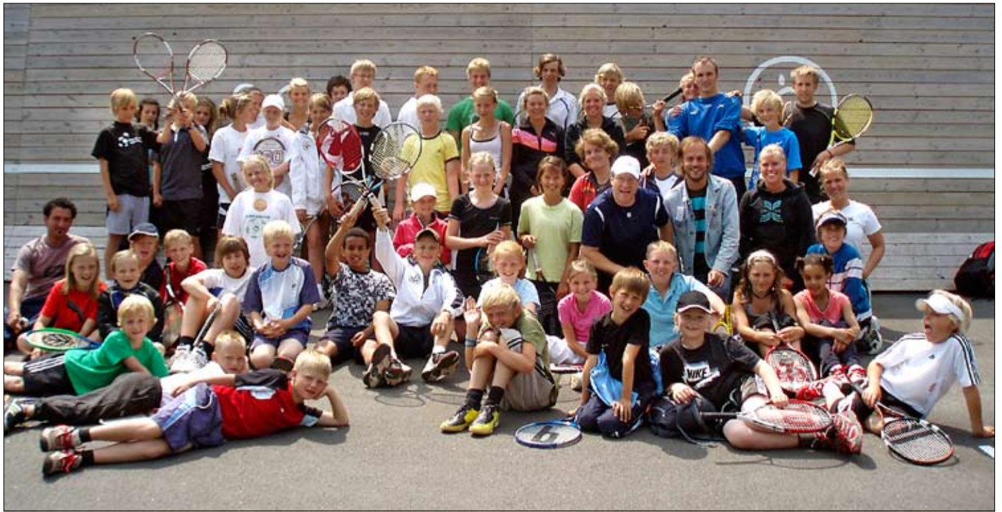
Rosenholmslägrets deltagare 2008.