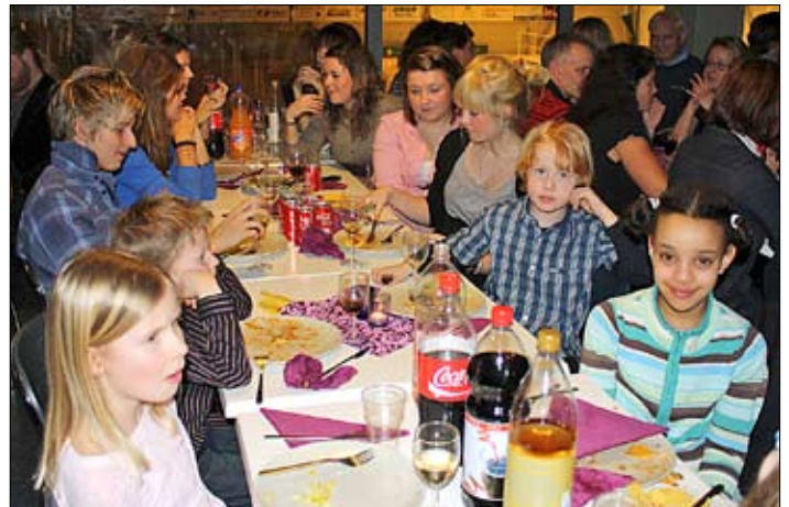
Stora som små medlemmar hade roligt på festen.