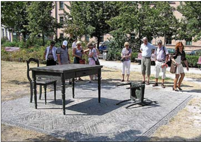
Minnesmonument i de gamla judiska kvarteren i Berlin.

35 grader, vindstilla och klarblå himmel! Det var de grundläggande förutsättningarna för det årliga vänutbytet mellan KTK och TC Grün-Weiss, Nikolassee. Dessutom ökade temperaturen i takt med att Tyskland gick vidare i fotbolls-VM.