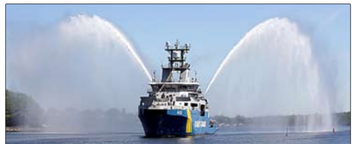
Kustbevakningens nya fartyg Amfitrite.