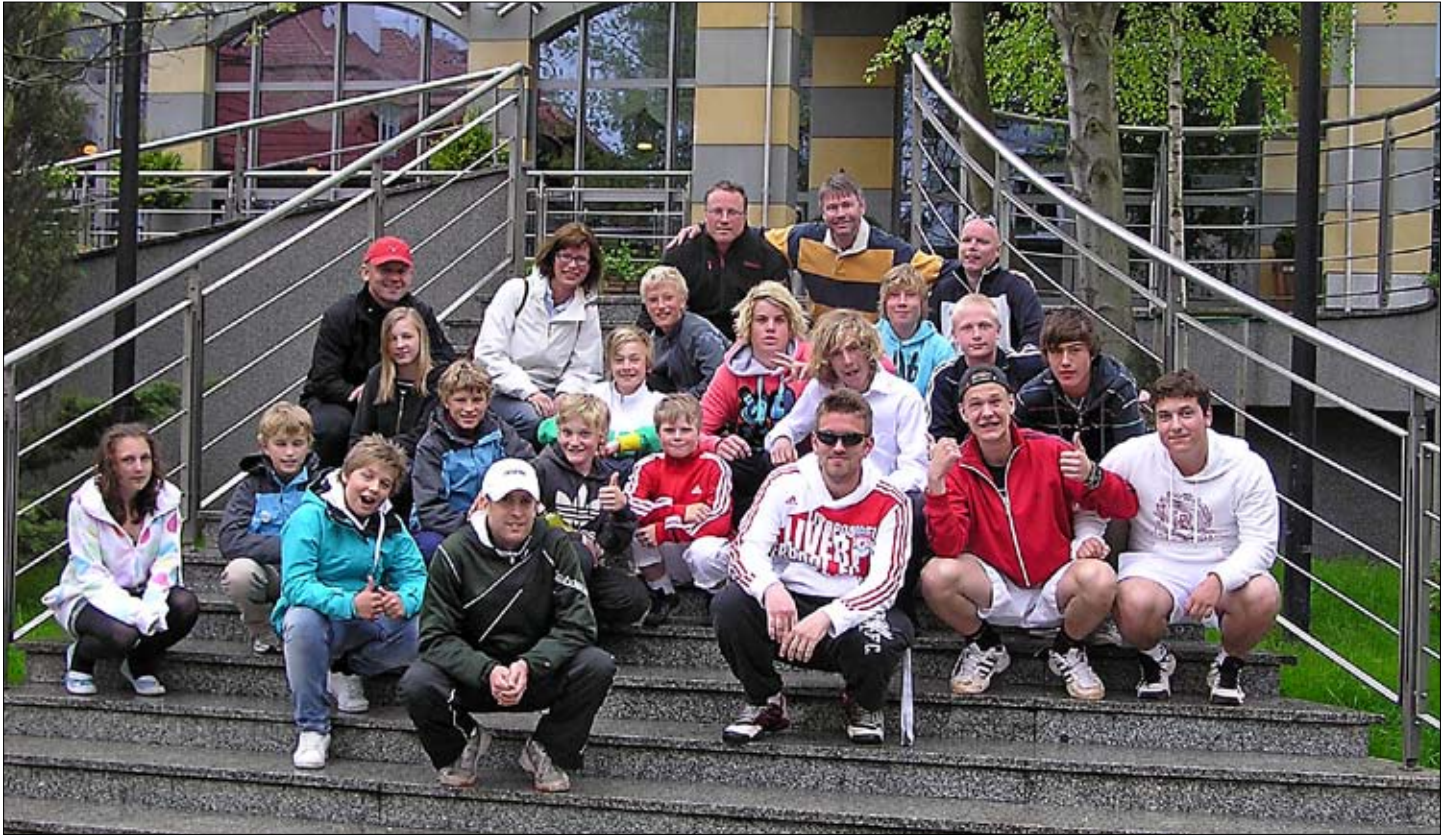
Deltagarna i Polenlägret sitter samlade för den obligatoriska gruppbilden.