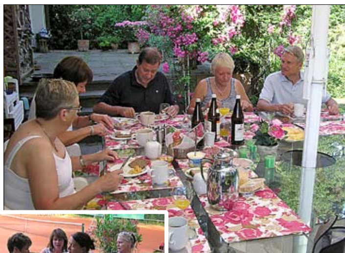
Frukost hos Opa och Ulrike.