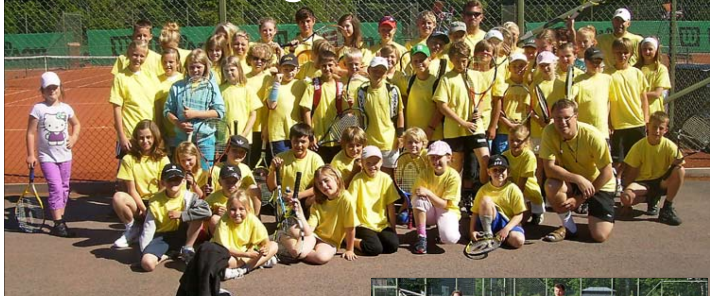
Deltagarna i årets upplaga av Rosenholmslägret.

Karlskrona TK har genomfört "Rosenholmslägret", som är ett årligen återkommande läger för alla juniorer – såväl bredd som elit.