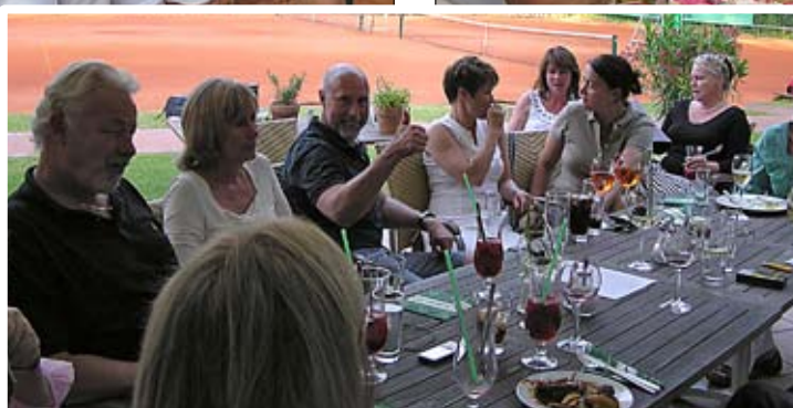
43:e omgångens vänutbyte bjöd på gassande sol och fantastiskt umgänge. Som synes var humöret lika strålande som vädret.

de förföljelsen och deportationen av judarna.