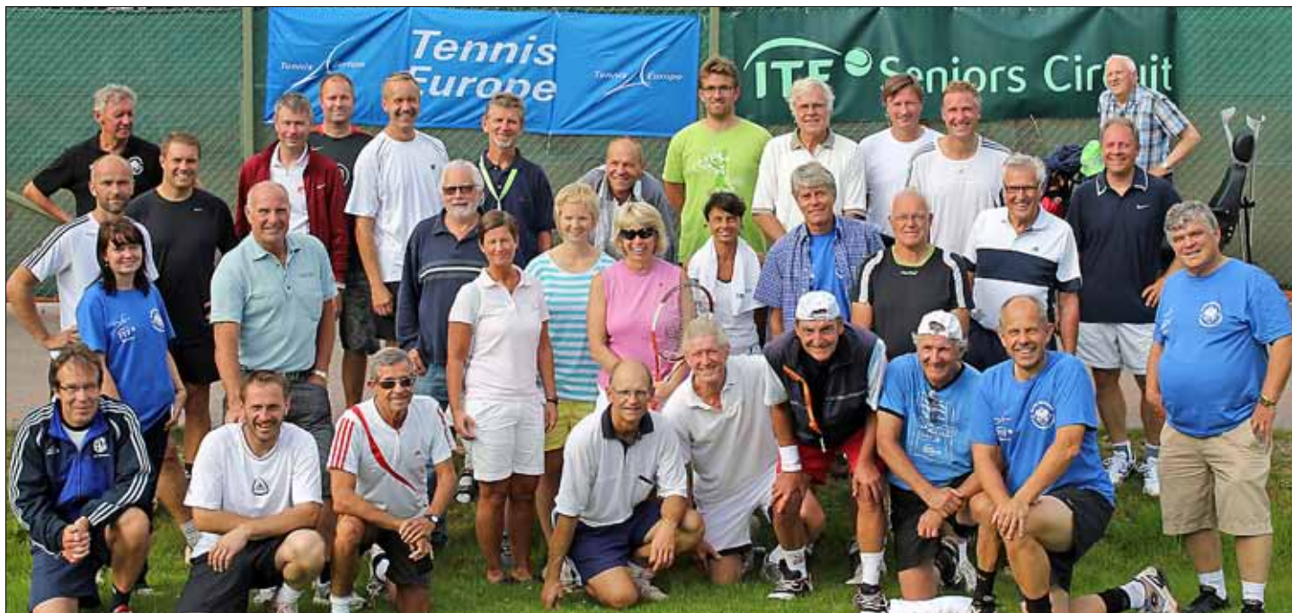
Alla deltagare i den första upplagan av Karlskrona International Senior Trophy samlade. Tävlningen avgjordes i bra väder och god stämning,

Fint väder, god mat, underhållande tennis, festligheter, båtturer och en hjärtligt skön stämning. Så kan första upplagan av KTK:s internationella veteran tävling, som hölls i slutet av augusti, sammanfattas.