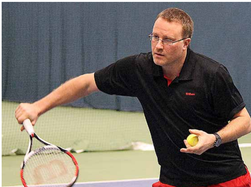
Gör som Daniel, spela mycket tennis i sommar så blir inte höststarten så trög.

Glöm inte tänka på de tips du fått av dina tränare. Tipsen i sig gör dig inte bättre, utan det är din förmåga att ta till dig och träna på dessa saker som är det viktiga.