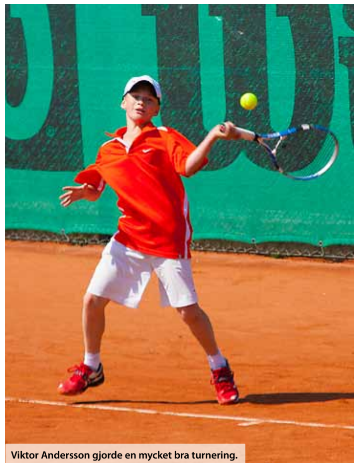
Viktor Andersson gjorde en mycket bra turnering.

Text: Sophie Aliksson