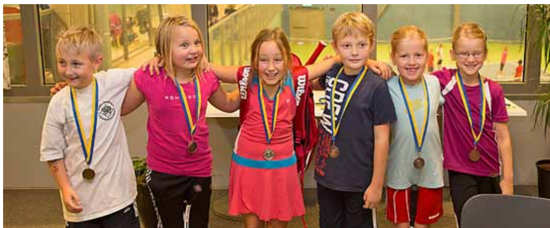
Glada vinnare i knattecupen och klubbens framtid.