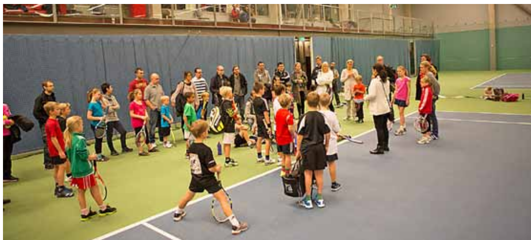
Det andra temamötet har hållits, som handlade om livet på klubben.