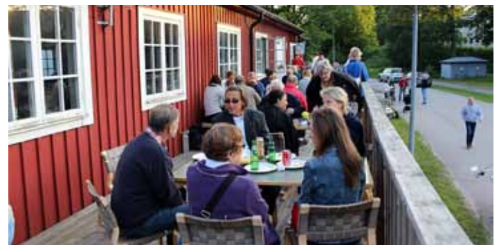
Fredagen avslutades med en grillkväll.

Tyskarna var mycket imponerade av KTK:s oerhört fina gräs-