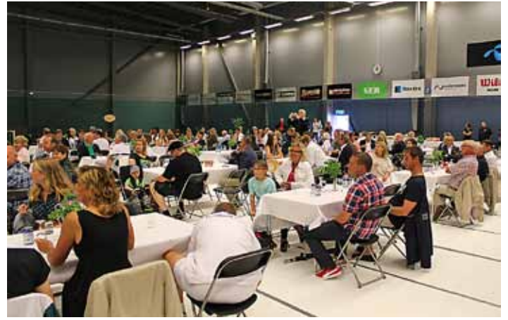
Festdeltagare på bana 2.