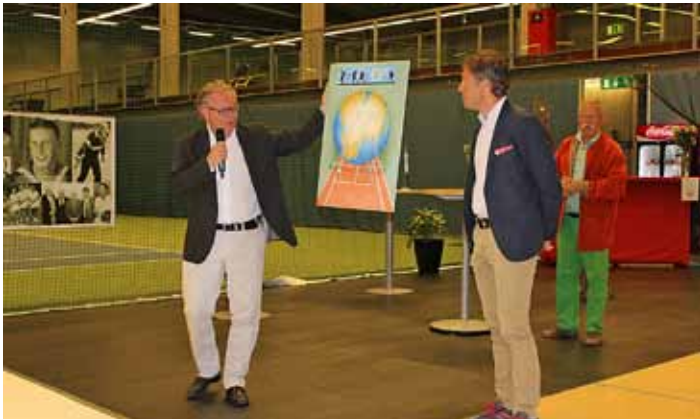
Tavla från Tennis Syd överlämnas.