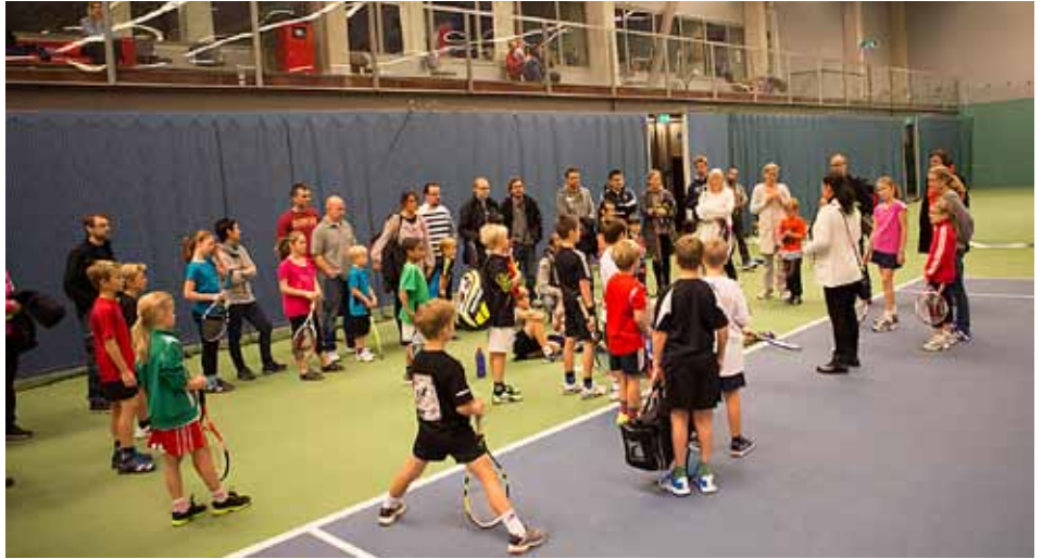
Nu börjar inomhussäsongen efter en fantastisk utomhussäsong.