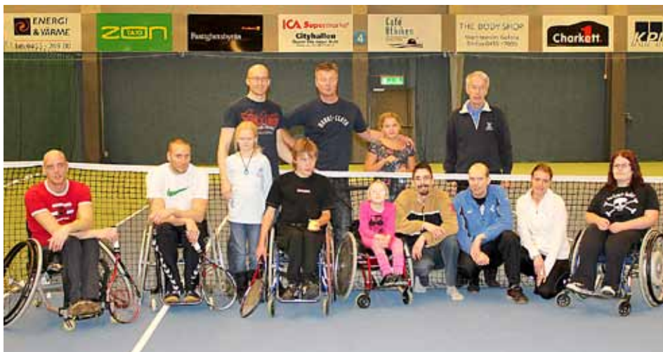
En rullstol är inköpt för satsning på rullstolstennis. Bilden är tagen i samband med rullstolstennis 2011.

ständigt utvecklas. Utveckling kräver investeringar och investeringar kräver goda ekonomiska resultat som sedan reinvesteras i verksamheten. Allt för att göra erbjudandet till medlemmar och gäster bättre över tid. Ibland glömmar vi att medlemmar inte bara är medlemmar utan också kunder och bör bemötas som sådana.