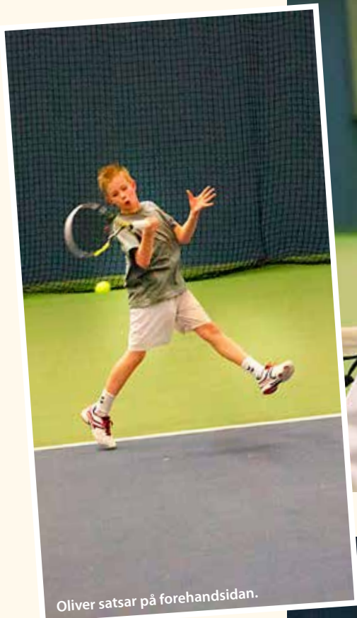
Oliver satsar på forehandsidan.