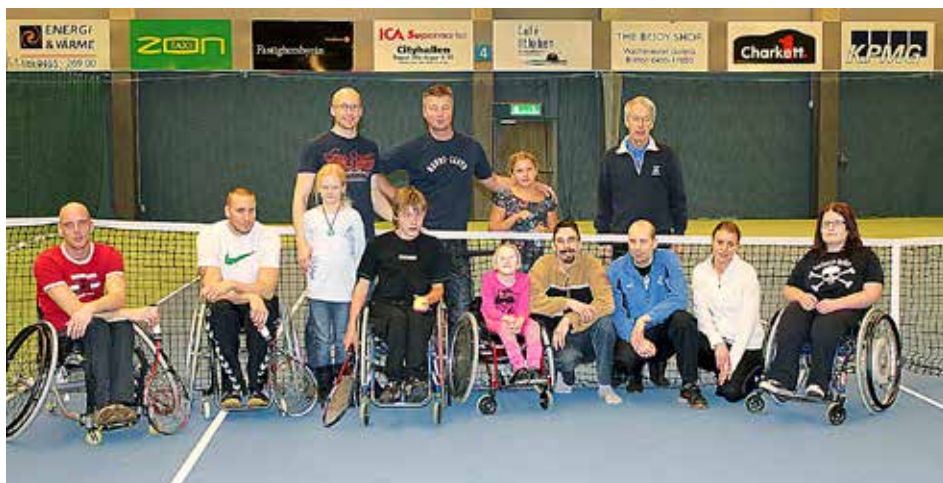
En av satsningarna i treårsplanen är att öka tillgängligheten på anläggningen för funktionshindrade.