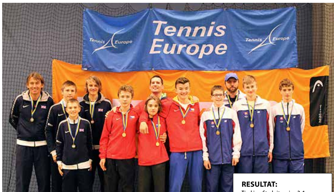
På bilden, fr. v.: Storbritannien, Tjeckien, Slovakien.