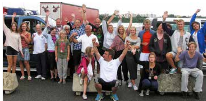
Så här glada var deltagarna på utbytesresan till Berlin 2012.