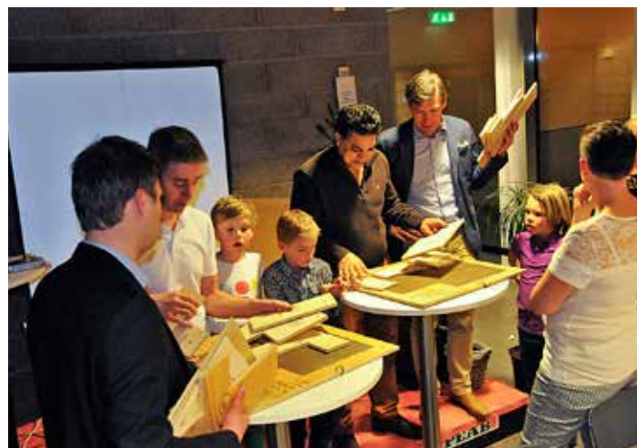
Lekar och spex förenade gammal som ung under årets årsfest hos KTK.