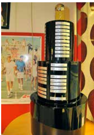
KTK:s nya vandringspris som Patrik Karlsson designat och konstruerat.