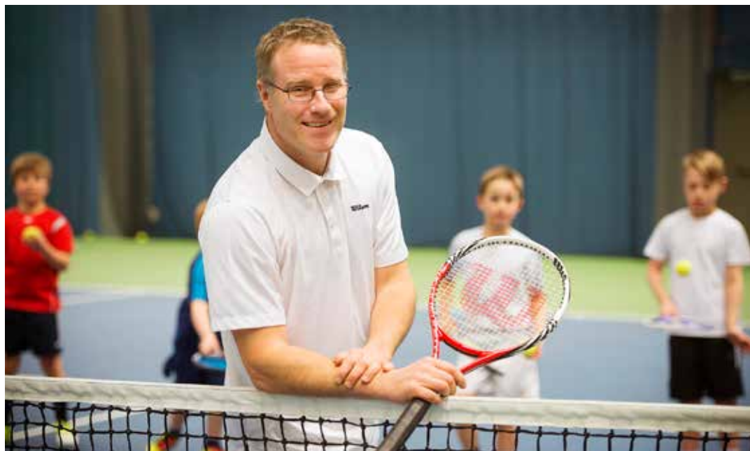
Inställning, taktik och teknik är viktiga faktorer man inte får glömma bort i träningen.

• En viktig egenskap i dagens tennis är att kunna "gå in i banan" när läge ges och också att i slaget jobba in i banan och eventuellt