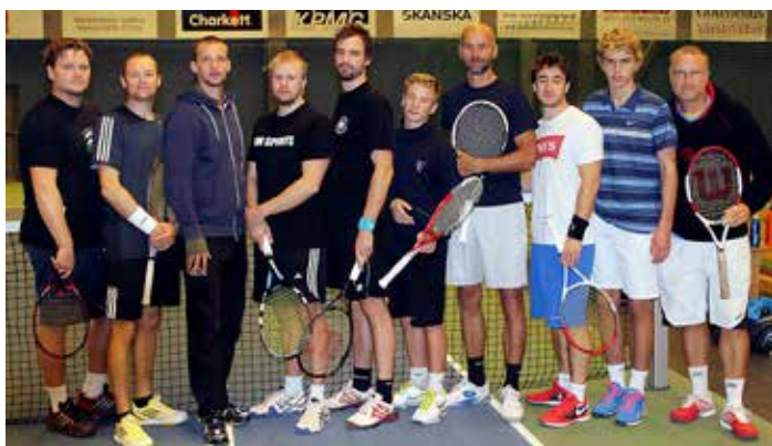
Herrlaget tog poäng och skrev historia för Karlskrona TK:s räkning.