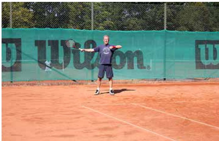
Grusbanorna var fina vid tyskarnas besök, så fortsatt gärna att spela ute.

Vi utvecklas ständigt, i dagarna har vi fått OK från kommunen på alla parametrar avseende vår planerade byggnation av Hard Court och Paddle banor. Det har suttit långt inne och många, med