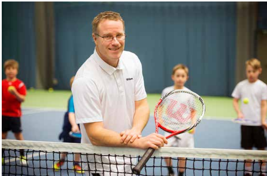
Karlskrona Tennisklubb har haft en sommar fullspäckad med olika tennisaktiviteter.

Under hösten kommer vi att göra en gemensam tävlingsresa till Kalmar under höstlovet. På hemma-plan har vi Head Cup för 14-åringar och yngre 20-22 november. För alla medlemmar kommer vi att ha