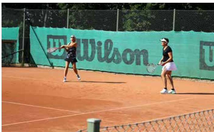
Gästernas damer ordnade att hemmaklubben fick se sig besegrade.