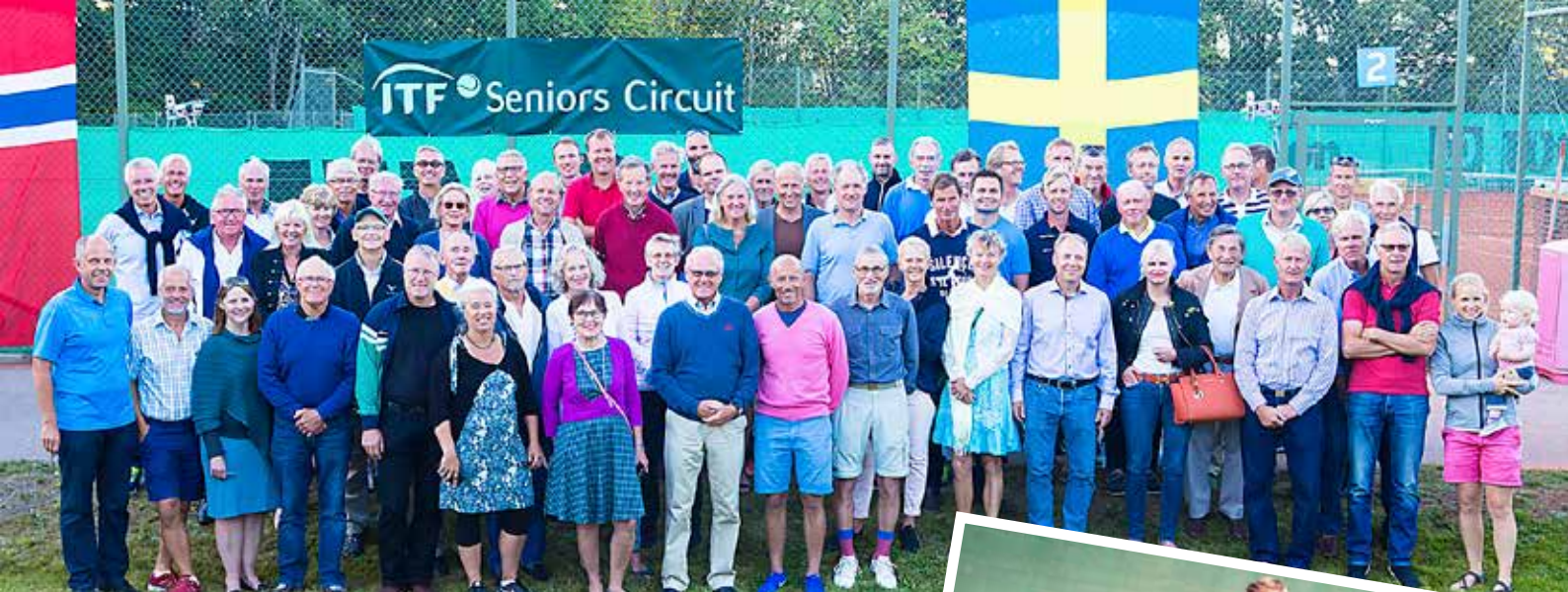
Glada deltagare redo för festligheter efter hårda fajter på tennisbanorna.