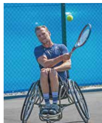
Rullstolstennis i världsklass invigde hardcourtbanorna utomhus.