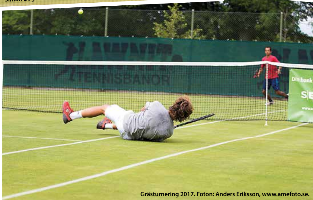
Grästurnering 2017.