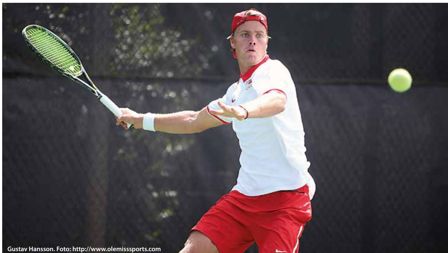
Gustav Hansson.