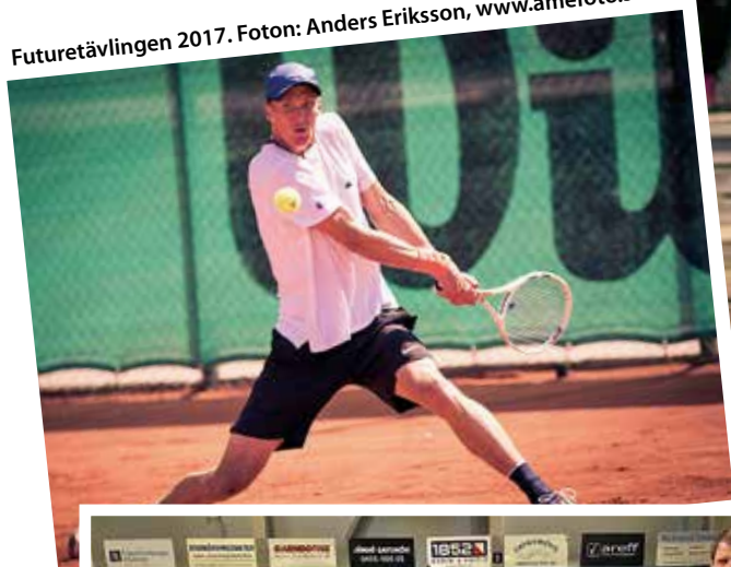
Futurertävlingen 2017.