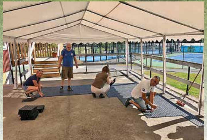
Dansbanan byggs upp i vår nyinköpta festlokal.