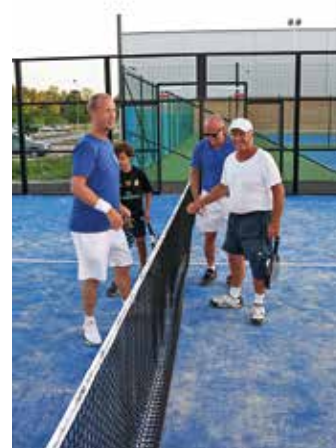
Generationer spelar Sommartoppen.