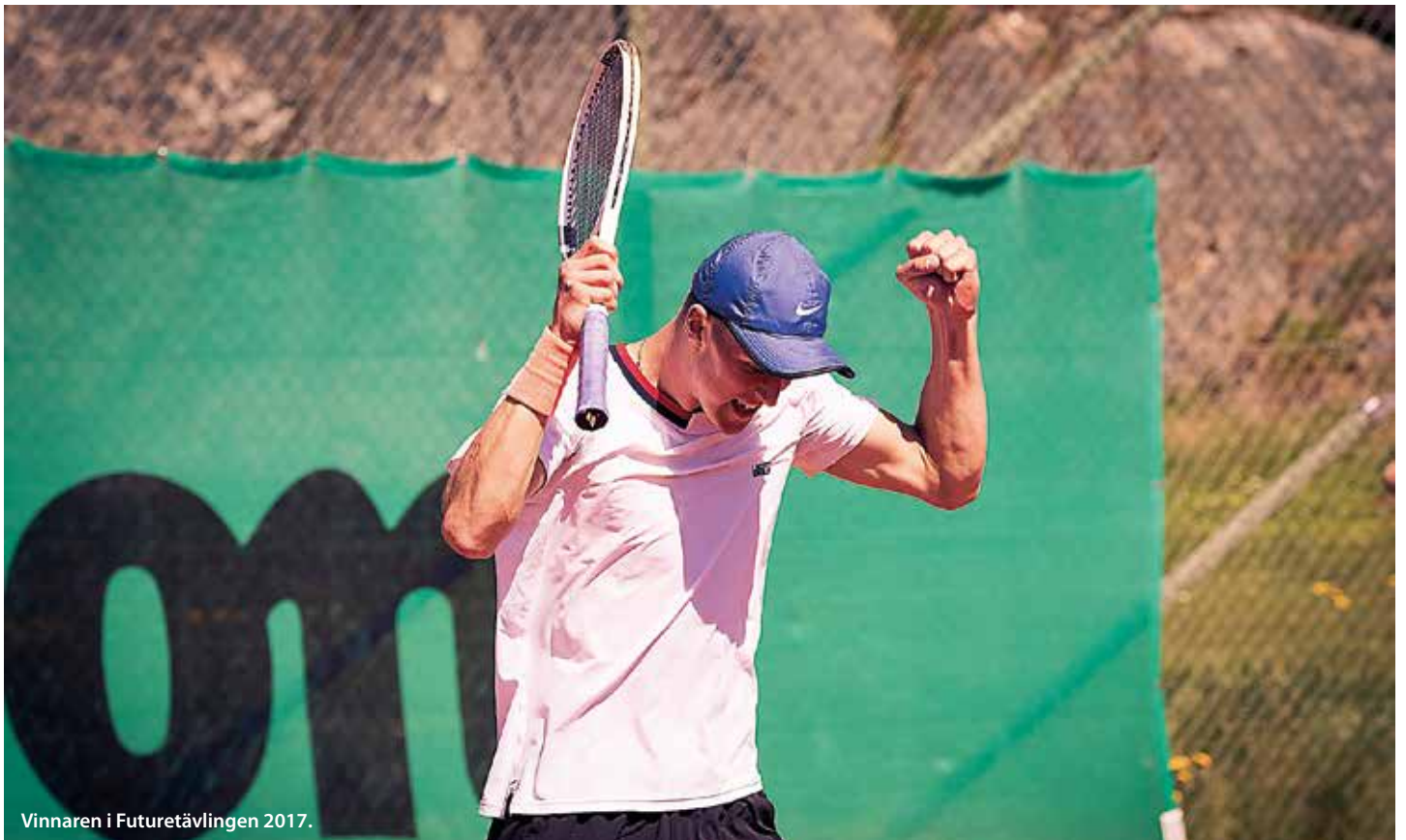
Vinnaren i Futuretävlingen 2017.