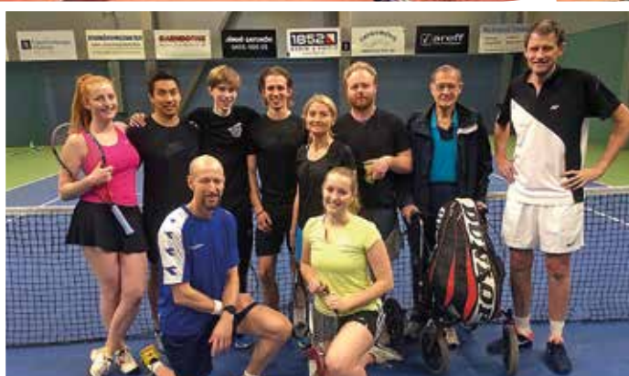
Hela racket-klanen Carleke spelar tennis.