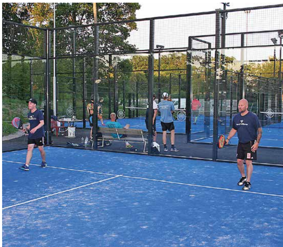
Padelspel på de nya banorna i sommarkvällen.