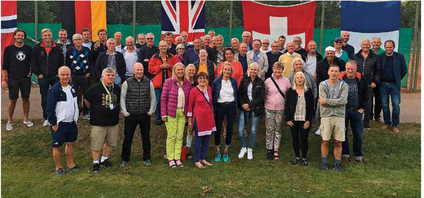
Karlskrona International Senior Trophy genomfördes för sjunde gången i augusti. Ca 90 veteraner från sju nationer gjorde upp om titlarna och sköna världsrankingpoäng.