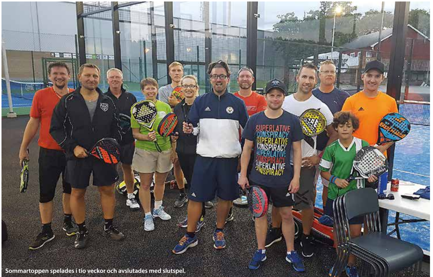
Sommartoppen spelades i tio veckor och avslutades med slutspel.