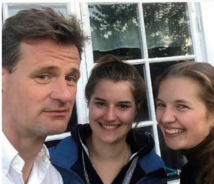
Två tyska damer får en selfie med en känd tennisspelare.