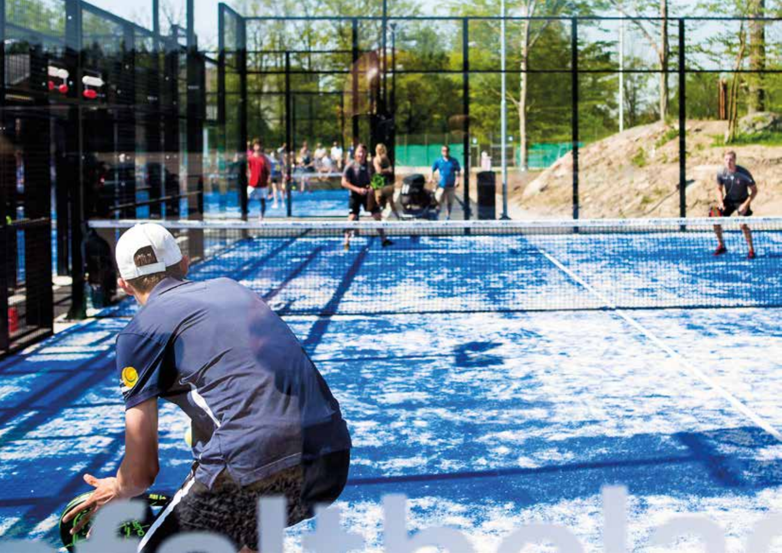
Invigningen av Padelbanorna ägde rum den 20 maj.