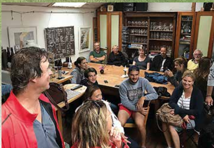
På Aspö kulturbrggeri lärde vi tyskarna hur man gör öl.