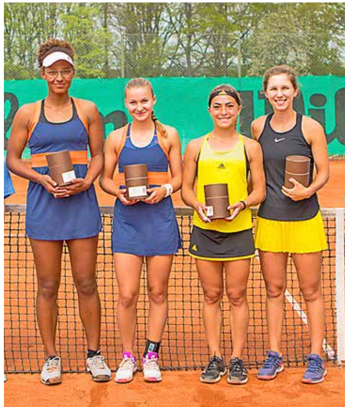
Finalisterna i damdubbeln.