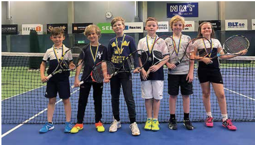
Flitiga deltagare i Tenniskolan.

nu startat och pågår fram t.o.m. fredag 21 december.