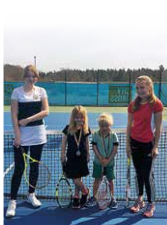
Glada barn och tränare som alla bidrar till en god stämning i klubben.