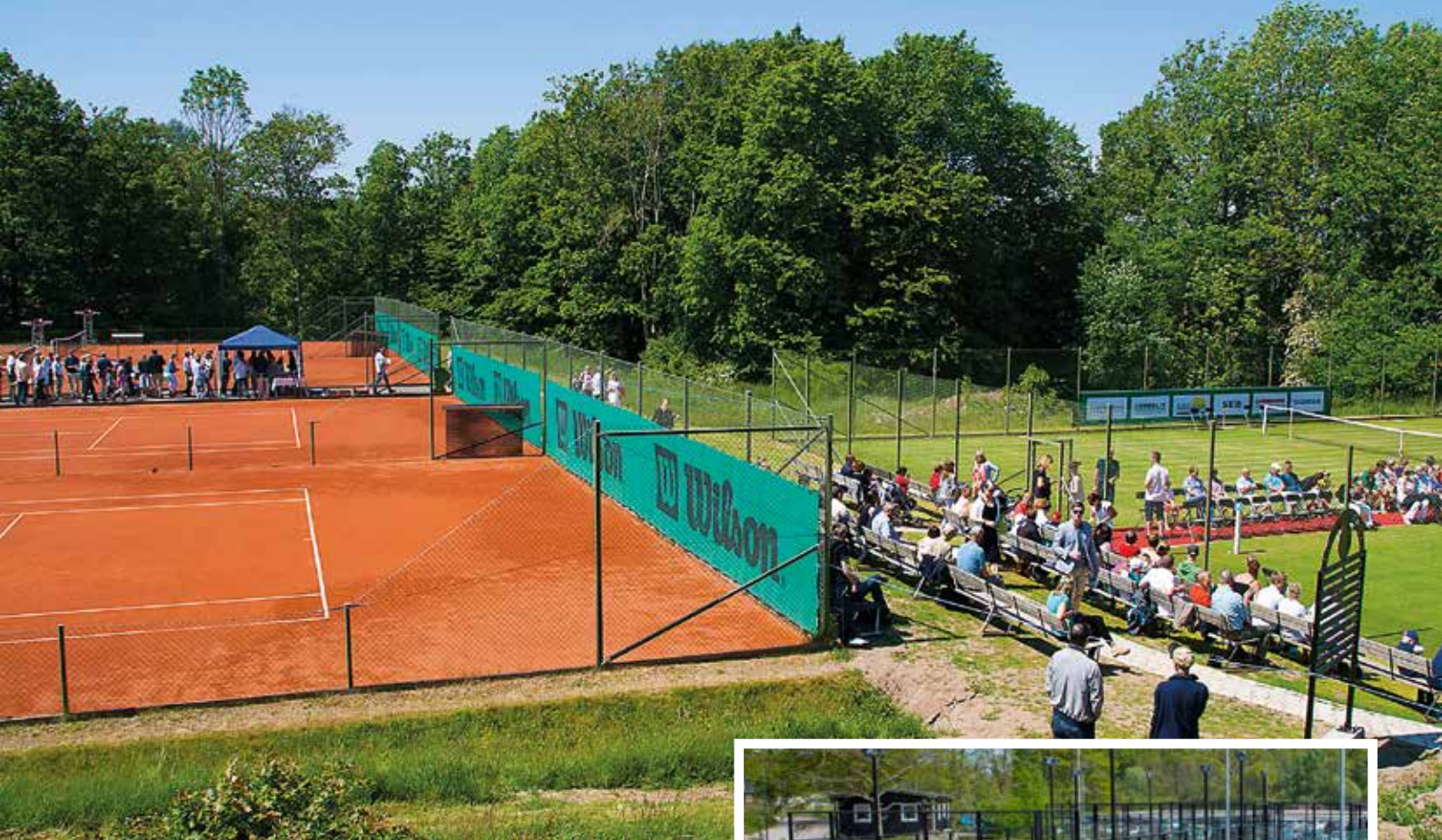
Arena Rosenholm – den kompletta anläggningen.