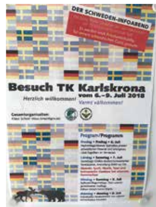
Ingen kunde missa att Karlskrona Tennisklubb var i staden.