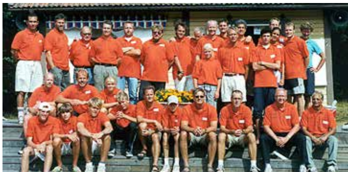
JSM-funktionärer 2001 på Klinteberga.