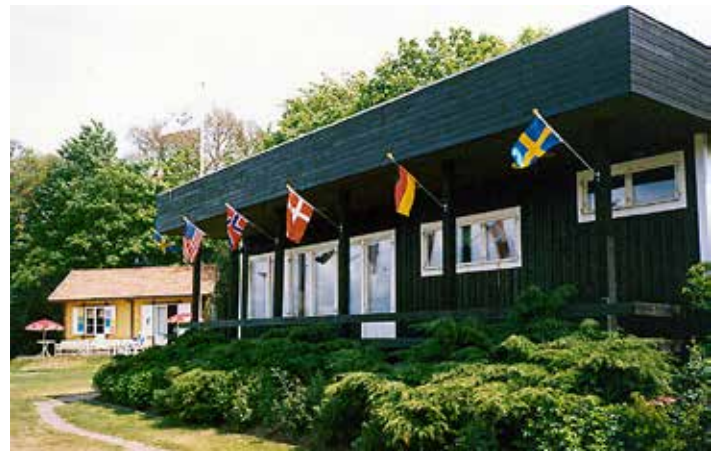
Klintebergas "nya" klubbhus i förgrunden.

Kommunen fick för sig att man måste ha en "mässhall", Östersjöhallen. Tur för oss, för den behövdes ju bara för mässor några veckor om året. Den byggdes 1987 på tomten bredvid Idrottshallen, med underbar utsikt från cafét ut över