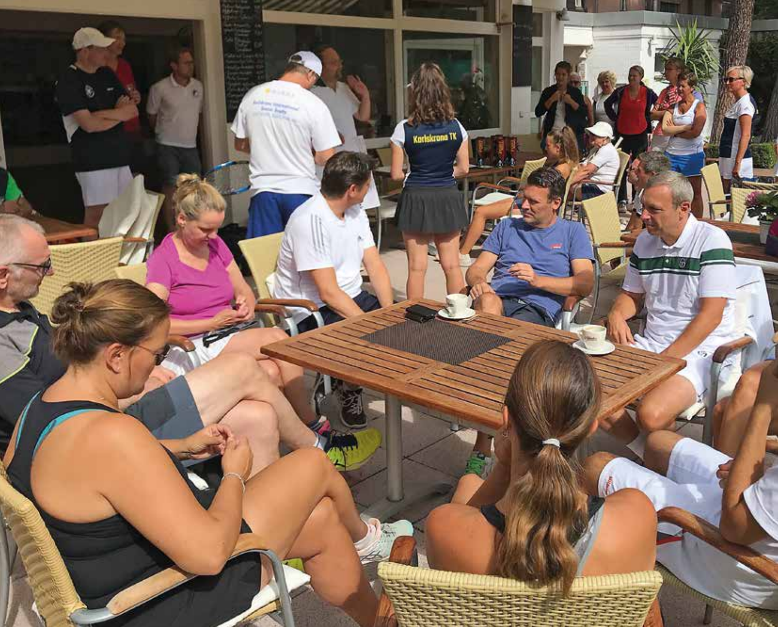
Tennisera, dvs socialt umgänge kring tennis.