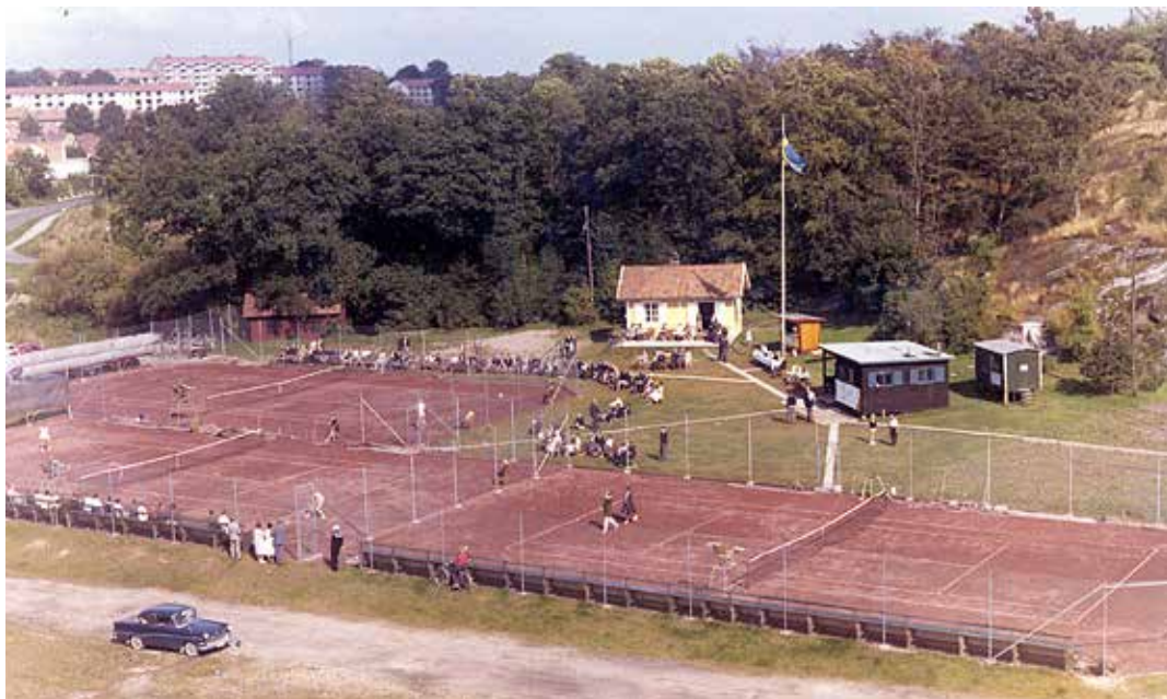
Invigningen av Klinteberga.