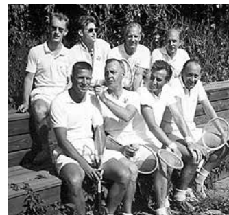
SM för oldboys på Blå Port 1958.