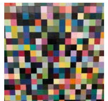
Vilken bild tror du är golvet på Tysklandsfärjan och vilken är en tavla av Gerhard Richter och kostar mer än en Mercedes.