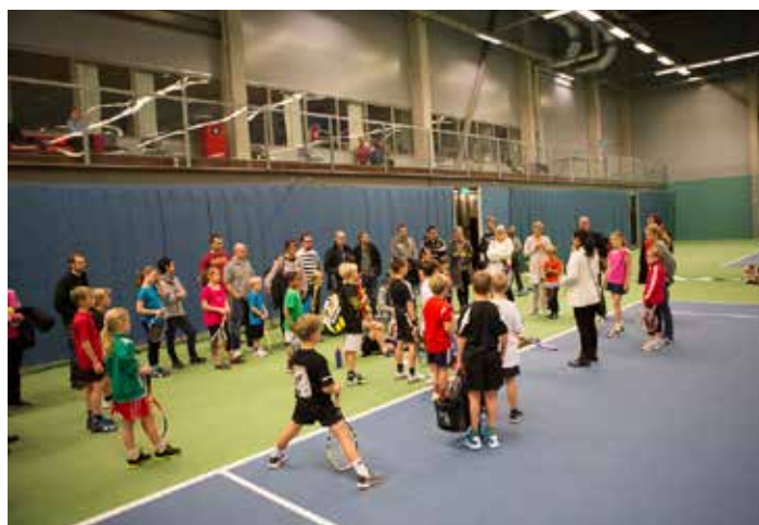
På Arena Rosenholm kan man träna och spela tennis inomhus, ute på grus, ute på gräs samt spela padel. En komplett anläggning, helt enkelt.