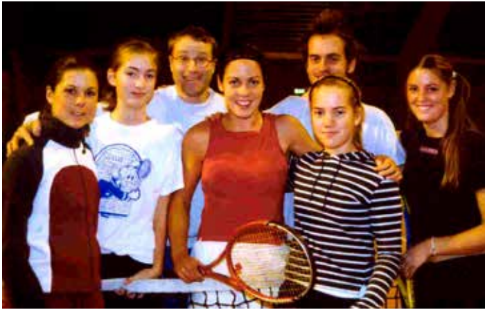
Duktiga tennisingdomar med sina tränare.