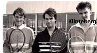
Östersjöhallen invigs 1986.

Klinteberga med tre banor var trångt vid tävlingar, men vi kunde komplettera med de två banorna på Gullberna. Anläggningen byggdes under åren ut med två gummi-asfaltbanor (Rubtan). Men de användes för lite och ändrades till grusbanor och kompletterades med två nya grusbanor – så var de sju. Nu kunde KTK vara värd för stora tävlingar (tex. BLT cup, som ersatte Ankarspelen), ibland i samarbete med Nättraby eller Ronneby.