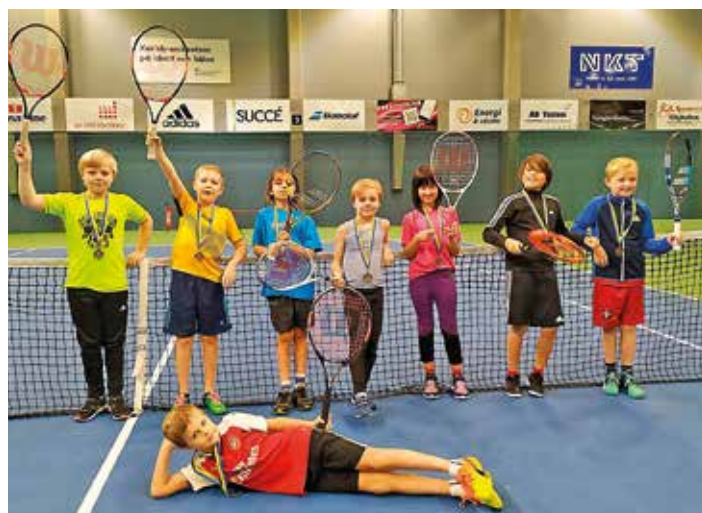
Deltagare i MiniMaxi Touren.