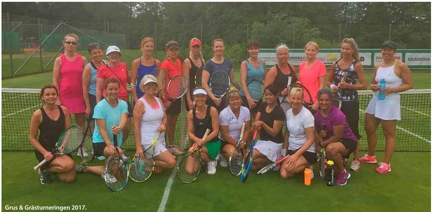
Grus & Grästurneringen 2017.