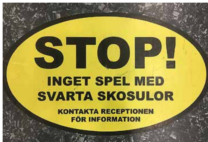
Du har väl inte missat dessa skyltar i vår inomhushall?

Vi driver Medlemshopen i första hand som en service till våra medlemmar och alla intäkter går direkt tillbaka in i klubben och möjliggör investeringar och utvecklingar av vår förening. Tack på förhand för att du väljer att stödja Medlemshopen och för att du tar hand om dig själv, din familj och våra banor genom att använda anpassade skor till ditt tennis- och padelspel.