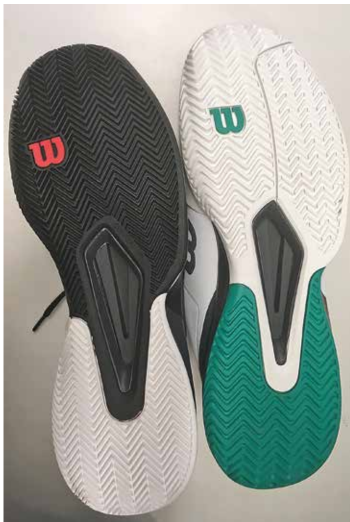
Grussula till vänster och Allcourtsula till höger.

Tennisspelare rekommenderas i första hand en allcourtsula, d.v.s. en sula som är gångbar på alla underlag. Den fungerar även hyfsat bra på grus för juniorer och motionärer, så länge den inte är för sliten (då blir den hal och det blir svårt att stanna och vända på gruset). En grussula rekommenderas om man spelar mycket på grus – då ger den en helt annan upplevelse på det hala gruset. Notera dock att en grussula aldrig ska användas inomhus då greppet på banan blir alldeles för bra och man riskerar skador.