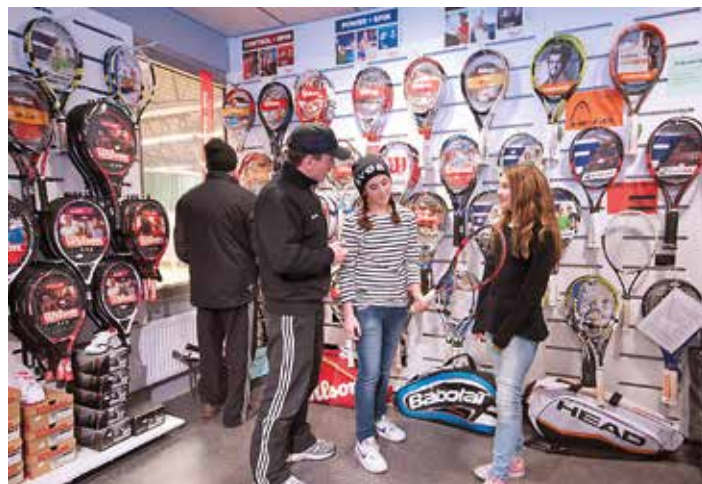
Välkommen in i Medlemshopen.