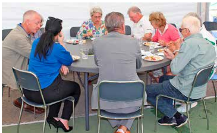
Sittning vid runda bord i serveringstället