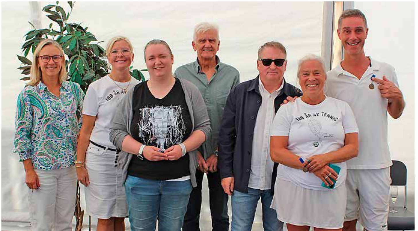
Bronsmedaljörer, mer är 5 års insatser i klubben.