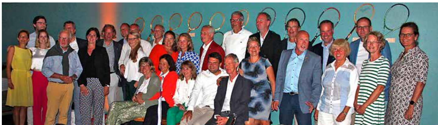
Samtliga tyska gäster samlade