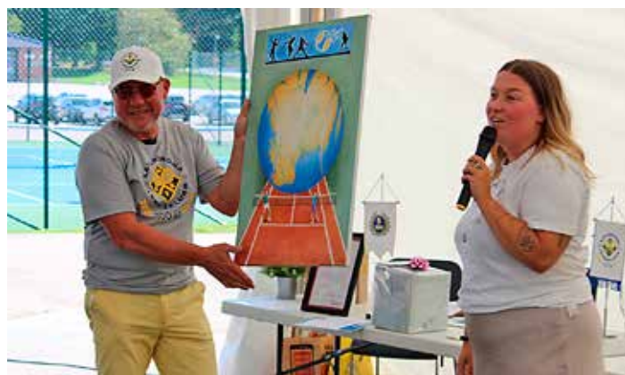
KTK mottog gåva från Region Syd.